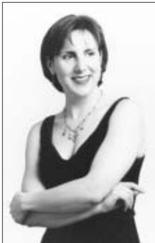
Dawn Upshaw